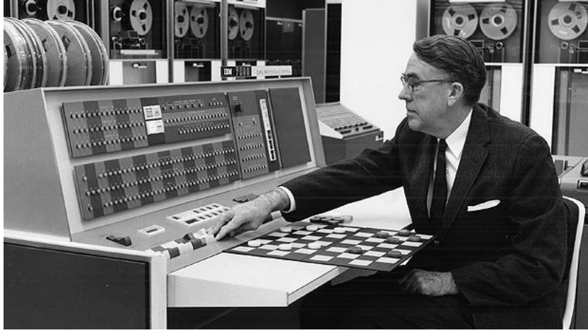
آرثر صامويل، أحد رواد الذكاء الاصطناعي، أثناء عمله على تطوير لعبة الضامة/الدامة

مدة زمنية قصيرة، تتراوح بين 8 و 10 ساعات، حتى وصل إلى درجة تفوق قدرات الشخص المُبرمج ذاته. وقد نشر صامويل مقالاً علمياً عن هذا الإنجاز في عام 1959.